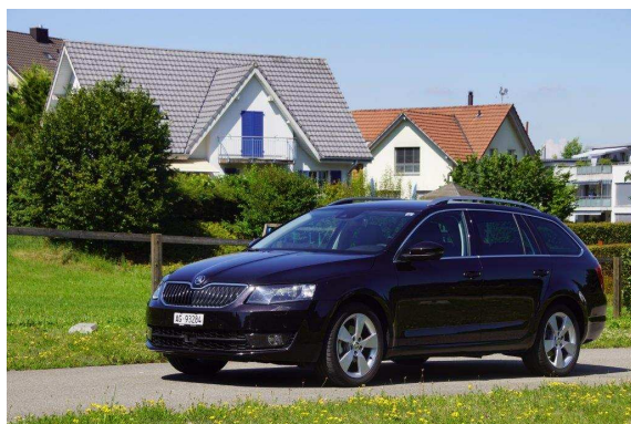
La voiture la plus verte de Suisse: ŠKODA OCTAVIA G-TEC avec DSG