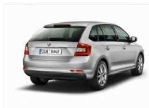
ŠKODA Rapid Spaceback ‚Swiss Joy‘