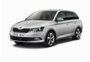
ŠKODA Fabia Combi ,Swiss Joy'