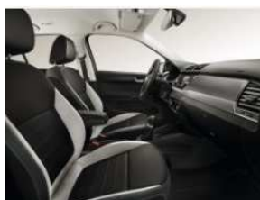
ŠKODA Fabia ,Swiss Joy'