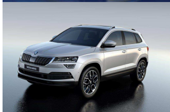
Premier salon: ŠKODA KAROQ