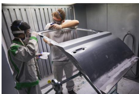
Immagine relative al comunicato stampa: