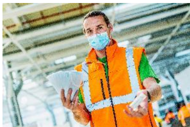
Immagine relative al comunicato stampa: