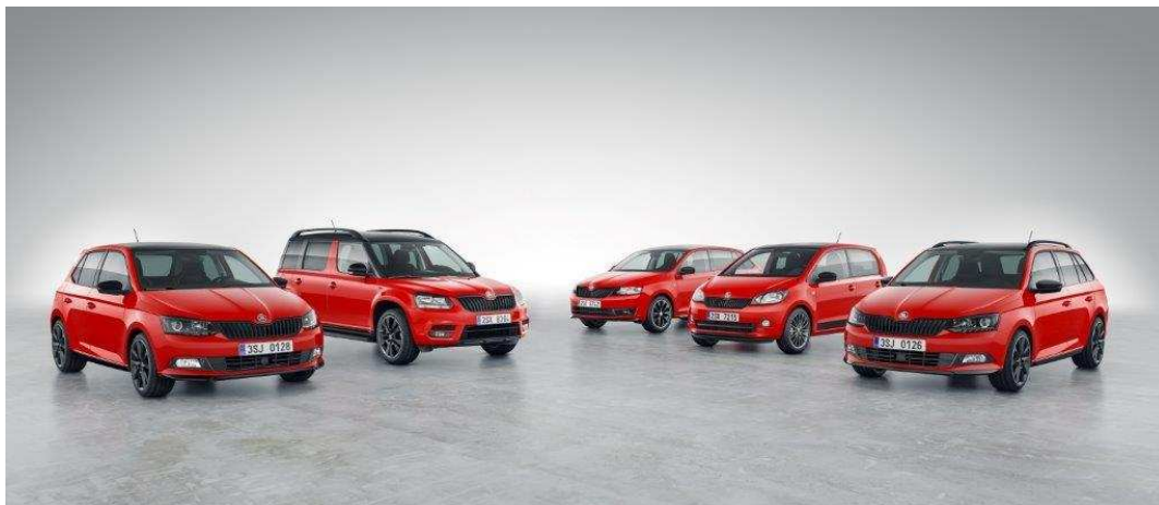
ŠKODA Monte Carlo Modelle