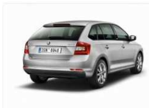
ŠKODA Rapid Spaceback "Swiss Joy"