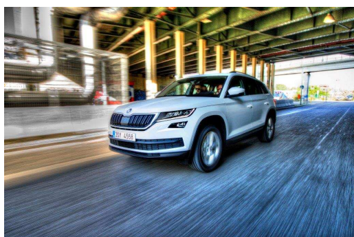
Le nouveau ŠKODA KODIAQ