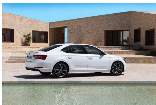
La nouvelle ŠKODA SUPERB SportLine