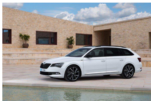
La nouvelle ŠKODA SUPERB SportLine, version combi