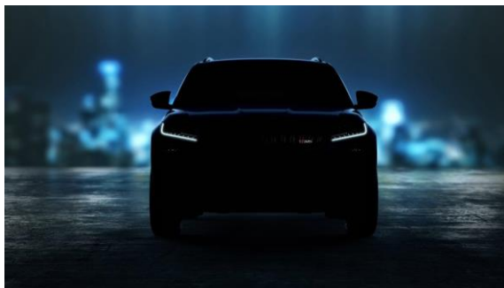
Immagine del comunicato stampa: